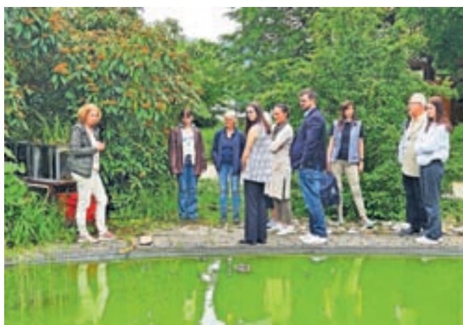
Obiskovalci so se sprehodili po posestvu in od blizu spoznali, kaj vse ponuja.