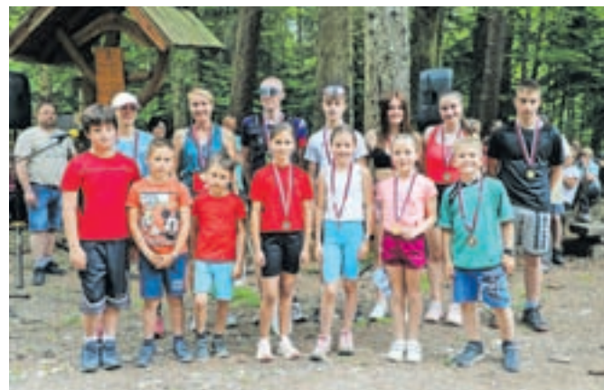
Udeleženci 22. Rokovnjaškega teka