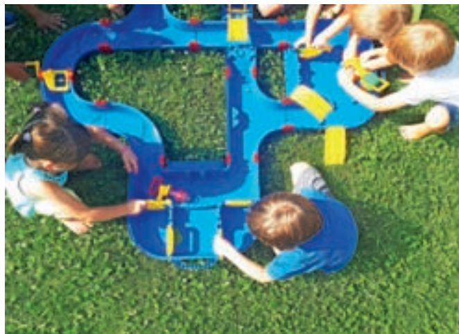
Mali graditelji v vodnem svetu

V času poletnih počitnic je v vrtcu prisotnih manj otrok. Največ je najmlajših, starih od enega do treh let, najmanj pa starejših, starih od tri do šest let. Otroci iz Vrtca Jelka v Dupljah obiskujejo dežurni Vrtec Mlinček v Naklem. Zaradi racionalne organizacije in letnih dopustov zaposlenih se skupine otrok združujejo glede na predhodno zbrane potrebe staršev. V času združevanja so otroci skupaj z ustreznim številom strokovnih delavcev iz matične enote. Otroci imajo tako možnost spoznati nove otroke in druge strokovne delavce vrtca. Včasih je to težava, drugič bogastvo novega okolja in novih prijateljskih vezi. Na splošno pa je to spodbuda