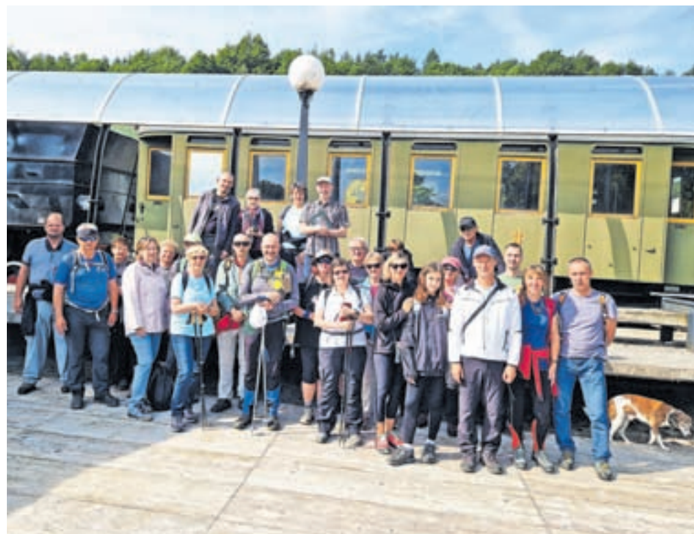
Pohod so začeli pri muzejski parni lokomotivi v Naklem.