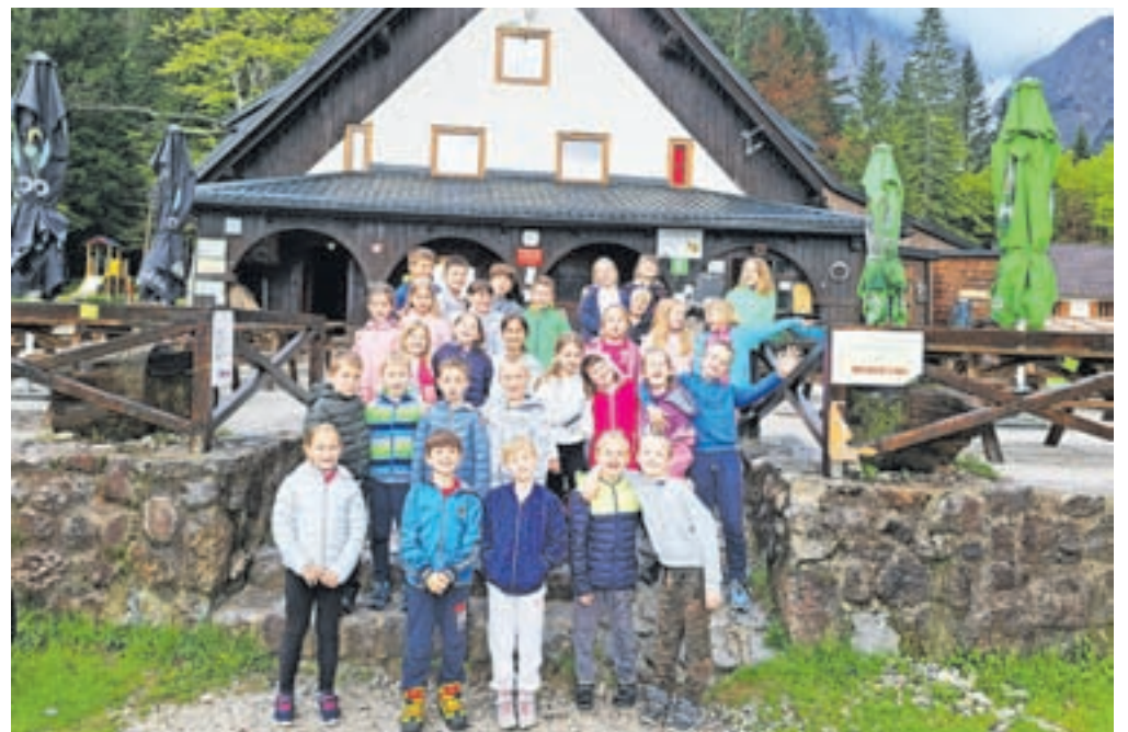
V maju smo se odpravili v Tamar.

pričakali starši. Ob zaključku šolskega leta planiramo pohod na Svetega Petra v še večji zasedbi – skupaj z družinami naših pohodnikov. Ponujen program je za otroke velika dodana vrednost, saj spoznavajo, kako prijetno je lahko gibanje v naravi