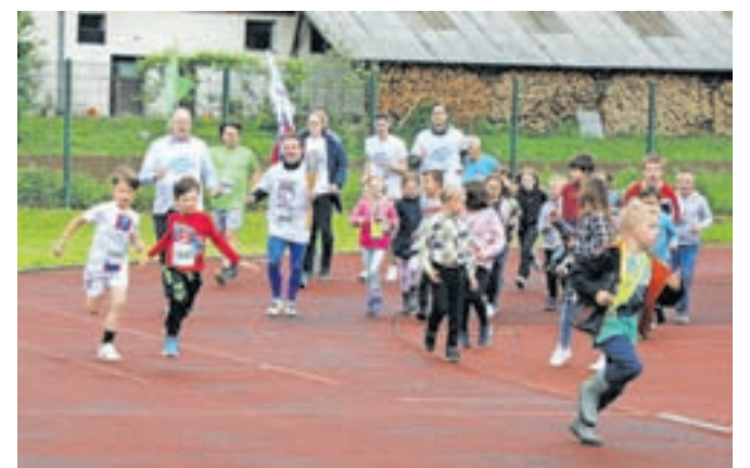
Simbolična podpora našim olimpijcem.

športna občina in veseli smo, da imamo tudi letos olimpijko in da je med nami tudi veliko olimpijcev, ki so zaključili športno kariero. Veselim se tako današnjega dogodka kot tudi olimpijskih iger in vseh športnih dogodkov, ki se bodo letos še odvili,« je dejal župan. Vsi udeleženci so za spomin na ta dogodek prejeli zapestnico jejkene volje.