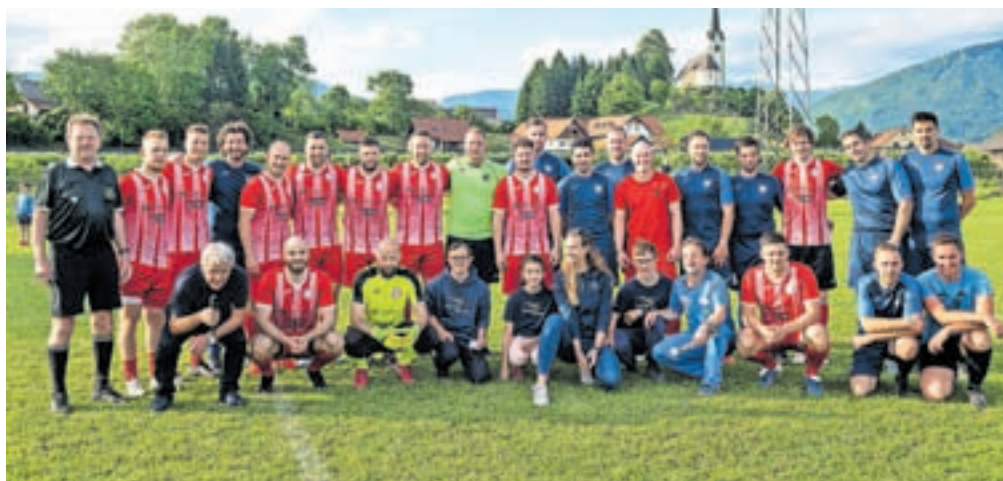
Ekipi hokejistov in domačih nogometašev z organizatorji, člani Plavalnega kluba Radovljica...