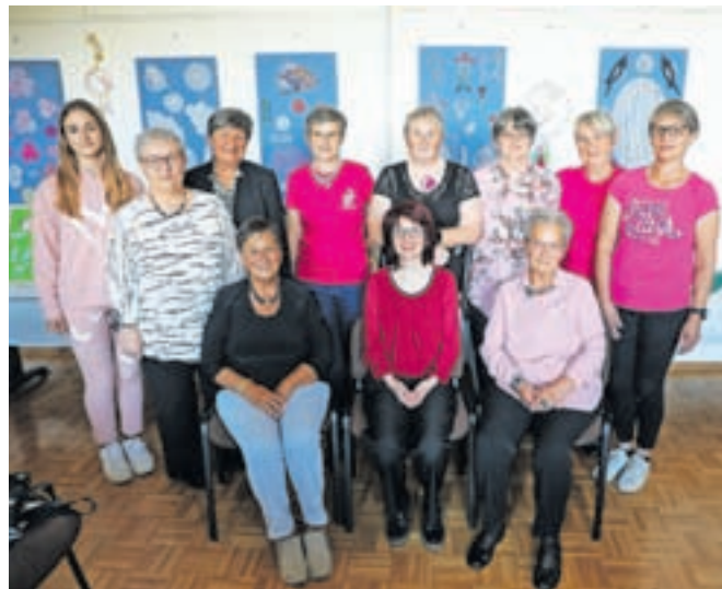
Podbreške klekljarice Taborske Urške