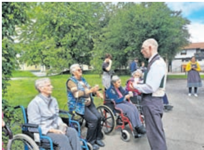
Cesarjev špancier po Naklem