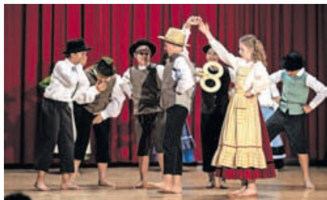
S plesom v poletje