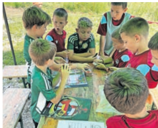
Izmenjava sličic Euro 2024