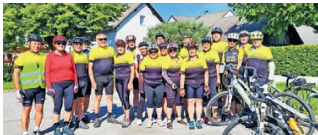
Prijetne temperature, sončno vreme ... in gremo na kolo.

16. Pohodniki pa so bili lani na desetih pohodih. Tudi letos bi radi dosegli to število. Dejavnost so balinarji, ki vabijo k množičnemu igranju na novem balinišču ob domu, kegljači, strelci, igralci pikada, tenisači in udeleženci vedno bolj razširjene igre štrbunk, ki so najboljši na Gorenjskem. Zato ni presenečenje, da je Društvo upokojencev Naklo najbolj športno društvo med srednje velikimi