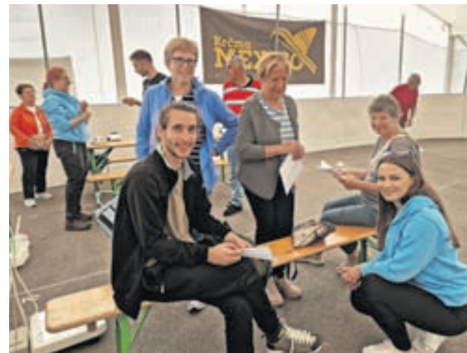
Izvajali so meritve krvnega tlaka, analizo telesne sestave, preverjali moč stiska roke, preverjali ravnotežje in aerobno vzdržljivost...