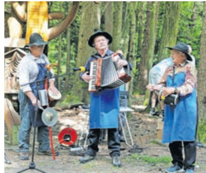
Za glasbeno vzdušje so poskrbeli godci Rokovnjači.