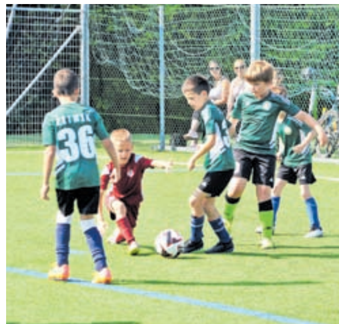
Na turnirju je nastopilo 12 ekip.

2024, striženje ob robu igrišča, poslikavo obraza in še veliko več, kar je ustvarilo sproščeno vzdušje in spodbudilo druženje med starši in otroki.« je poudaril Povše. Pred začetkom turnirja je bil poseben trenutek namenjen spominu na Draga Koštruna in njegovo družino, »kjer je bilo poudarjeno, da je turnir namenjen prvenstveno druženju in zabavi otrok«. Dogodek so organizirali starši ob podpori nogometne sekcije Športnega društva Naklo, ki so z veliko predanostjo in trudom poskrbeli, da je bil memorial izpeljan brezhibno. Njihova zavzetost za uspeh tega dogodka je dokaz, kako močno lahko skupnost deluje skupaj za dober namen. Kot je sklenil Primož Povše: »Memorial Draga Koštruna je bil več kot le nogometni turnir; bil je praznik športa, prijateljstva in skupnosti, ki postaja dogodek, na katerem se generacije združijo v igri in smehu.«