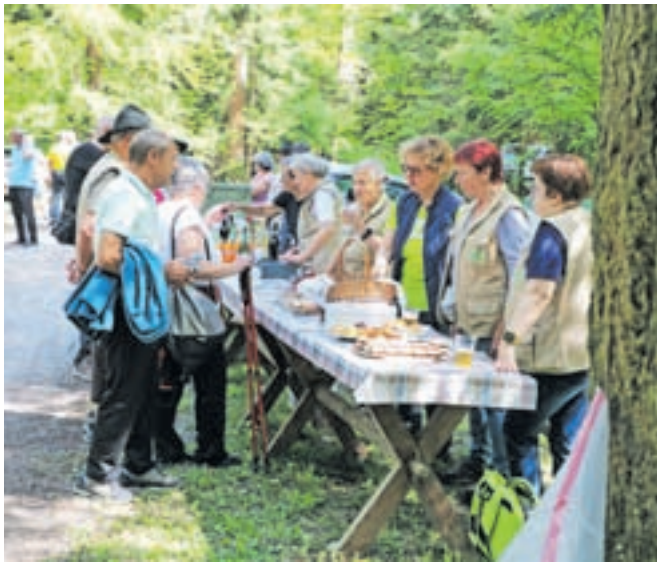
Sladkih dobrot po zaslugi dupljanskih gospodinj ni manjkalo.