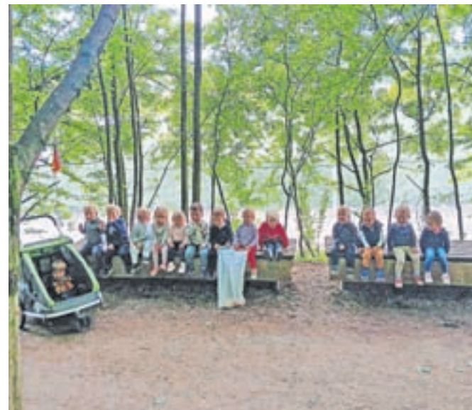
Čistilna akcija v Vrtcu Mlinček

Vsem udeleženi hvala za ohranjanje čiste narave in okolice, hkrati pa hvala tudi vsem strokovnim delavcem, ki ozaveščajo otroke, kako pomembno je, da ohranjamo naravo čisto. Po opravljeni akciji smo bili zadovoljni, otroci pa veseli, saj so naredili nekaj koristnega za našo okolico in naš planet.