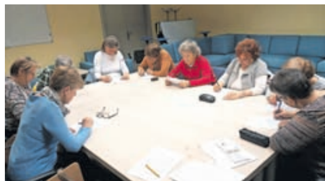
Pretekle dejavnosti medgeneracijskega sodelovanja

ločenosti med družinskimi člani. Ta vrzel lahko vodi v globok kulturni prepad med različnimi generacijami. Poleg tega program zagotavlja priložnosti za spodbujanje pozitivnih stališč in odpravljanje negativnih predsodkov, ki jih imajo ljudje do pripadnikov drugih generacij, še posebno do starejših. Pomembna komponenta programa je tudi vključevanje pripadnikov ranljivih ciljnih skupin, s čimer zagotovijo enake možnosti za vse generacije. Skozi gradnjo solidarnosti, zaupanja in medsebojne pomoči med generacijami program prispeva k učinkovitejšemu delovanju skupnosti. Z Ljudske univerze Kranj so sporočili, da boste tudi letos lahko uživali v pohodniških dejavnostih, ohranjali mlade možgane z umovadbo ter se preizkusili v kulinarčnih spretnostih. Na dejavnosti se boste lahko prijavi na telefonski številki 04 280 48 25 ali e-naslovu mck-prijava@luniverza.si .